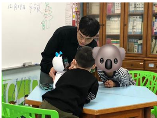
學生在實習課運用凱比機器人教學

學生參與；在實習課程上，學生實際運用凱比機器人、自製電子增強裝置等，自 111 學年度起，歷屆資源班實習學生均製作數位影片紀錄實習成果等，並發表在實習成果展。