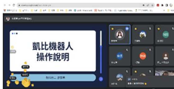
廖家蓁老師傳授凱比機器人的設計