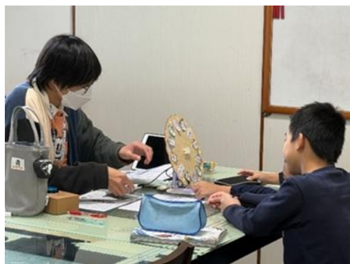
學生在實習課運用自製電子增強版