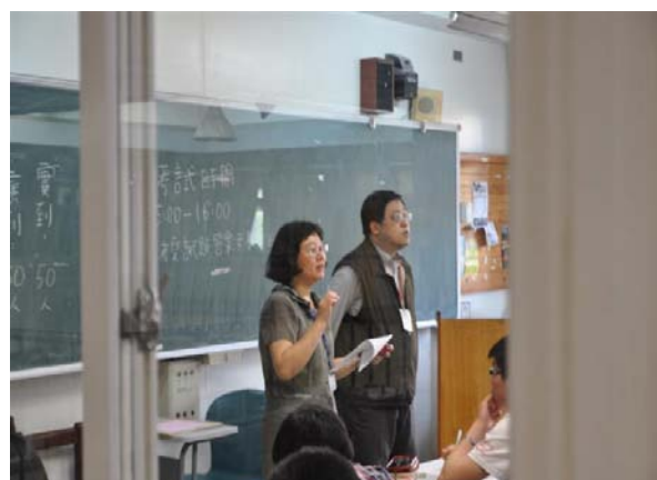
師資培育中心歐陽閻主任宣達注意事項