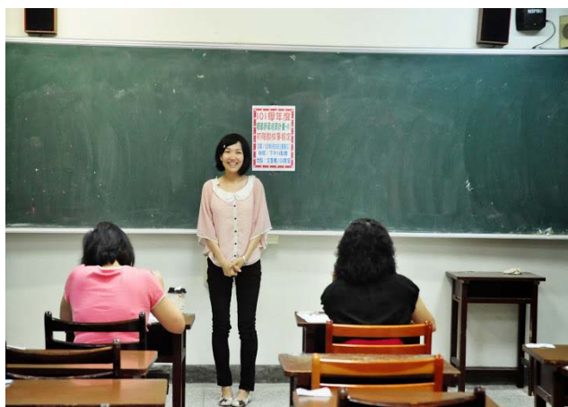
102 年 5 月 29 日師資生初階說故事檢定實錄