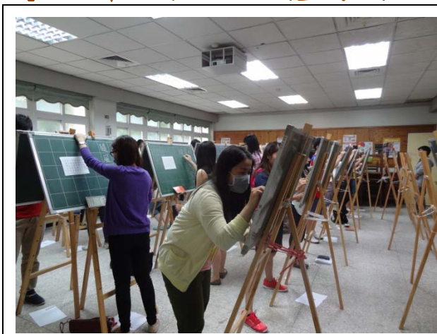
102 年 4 月 10 日師資生進階板書能力檢定

【102 年 4 月 10 日(星期三)、102 年 5 月 29 日(星期三)】