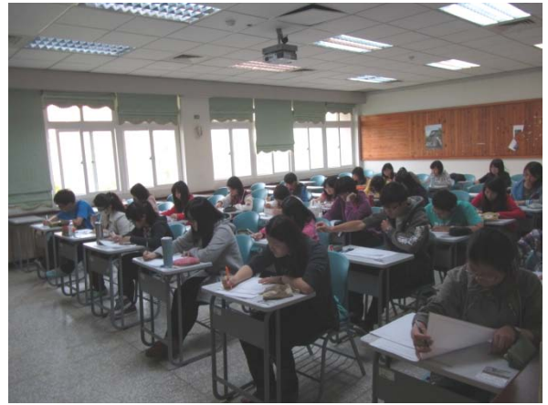
師資生數學能力測驗應考同學專心作答