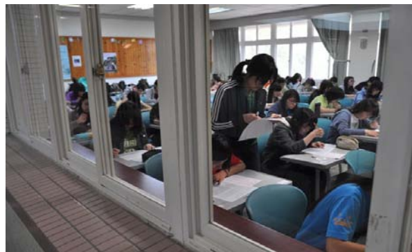
工作同仁，仔細檢查學生身份