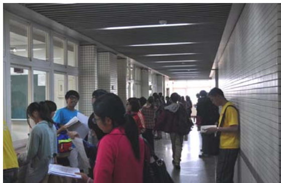
考前同學於試場外準備應試

102年3月20日(星期三)下午3時至4時，於文薈樓2-3樓舉行102學年度教育學程甄試考試，此次完成報名並參與考試的同學共634名，角逐中等學程、國小學程、特教學程與幼教學程共342個名額，競爭之激烈可見一斑。