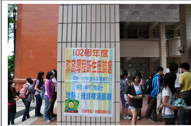
新生座談會當天，師資生進場領資料

此次各類教育學程的錄取同學除了於102年5月15日前報到，並繳交個人基本資料外，為了讓102教育學程甄試錄取同學，更加了解熟悉教育學程所有的課程架構與作業流程，師資培育中心特別於5月15日在本校雅音樓舉辦102學年度教育學程新生座談會，並印製新生手冊提供師資生最完整的資訊，作為教育學程修課依據。