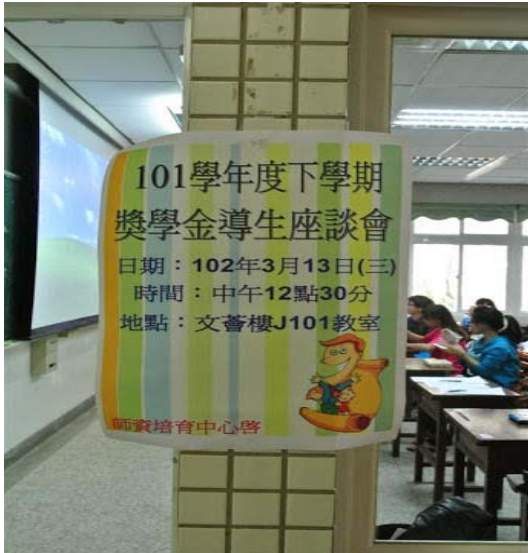
101 學年度下學期卓獎生座談會

師資培育中心對於 76 名卓獎生每個月召開一次班級會議，讓各組上台分享小組開會討論了哪些事情、作了哪些活動、遇到了哪些困擾，除了有助卓獎生進行自我學習檢視，更可進一步規劃及安排相關成長活動。