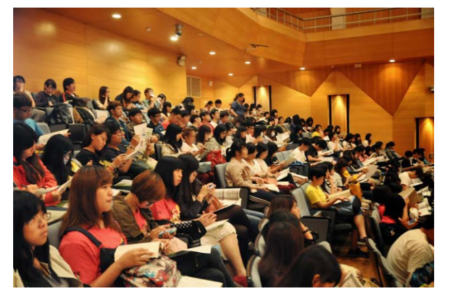
本校師資生專心聽講