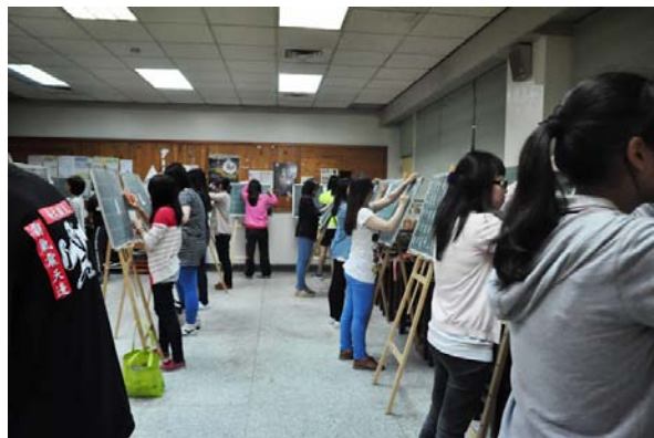
師資生初階板書能力檢定實況