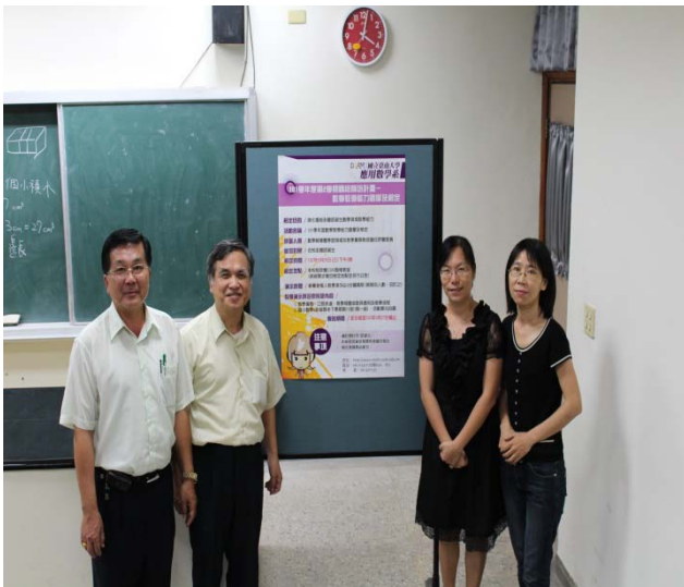
102 年 5 月 29 日師資生數學教學能力檢定