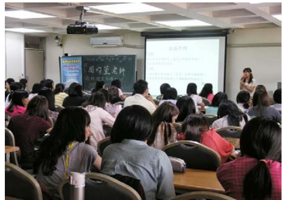
本校師資生專心聆聽周老師之分享