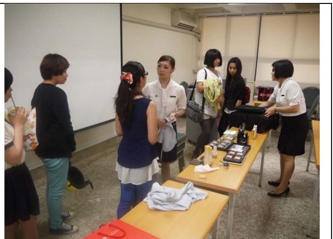
演講中，講師藉由自願同學，直接示範一些技巧 給同學們知道，演講結束後，同學也主動留下 詢問講師相關問題