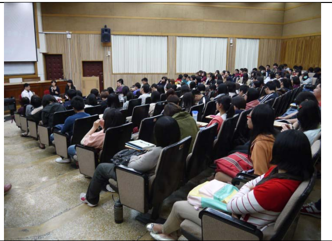
同學藉由特教系學生的與逆光飛翔中電影主角的訪談，更加了解身心障礙者們的想法，也讓同學了解該如何與身心障礙者們溝通互動