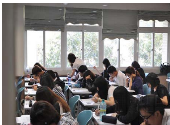
同學們屏氣凝神，仔細回答每一個試題