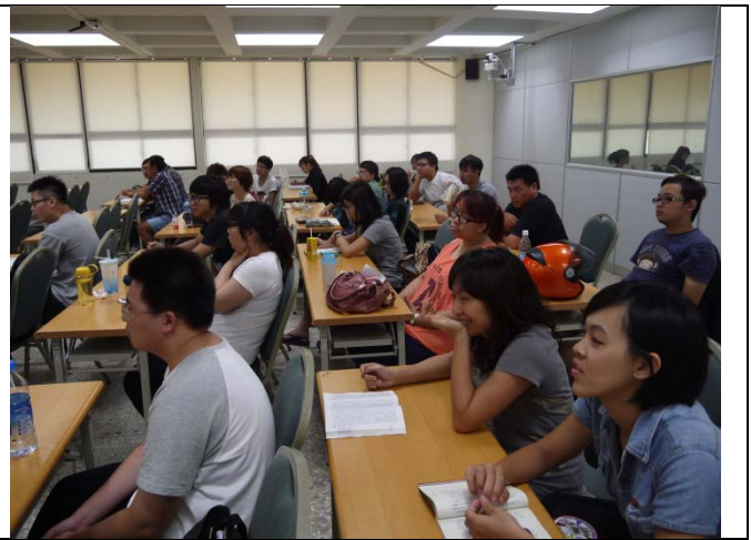
此次演講不同以往，講師並不是全程個人演講， 讓學生們主動發問，講師即時針對同學們的問題 給予回答