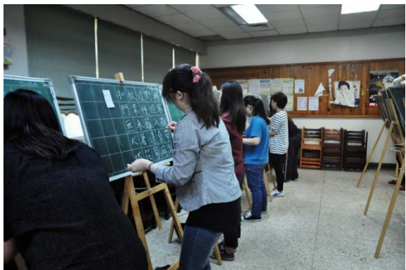
102 年 5 月 29 日師資生初階板書能力檢定 師資生認真書寫