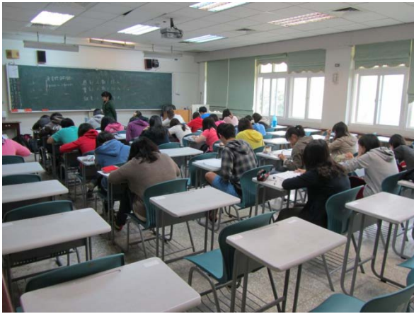
102 年 4 月 10 日師資生數學能力測驗實錄