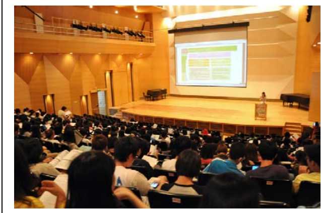
已錄取師資生踴躍出席