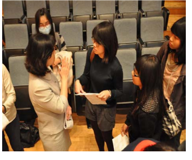
甄試說明會後，歐陽主任耐心為同學解說