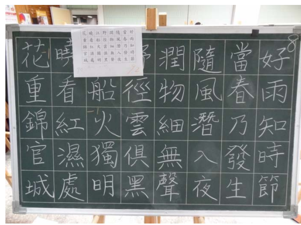
師資生進階板書能力檢定作品