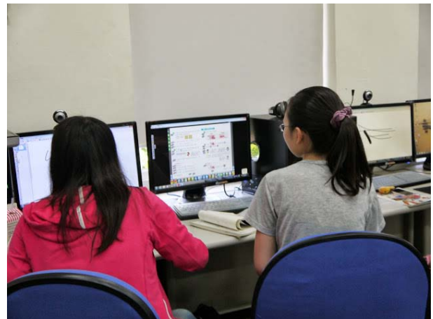
參與資訊融入教學能力檢定師資生實際演練