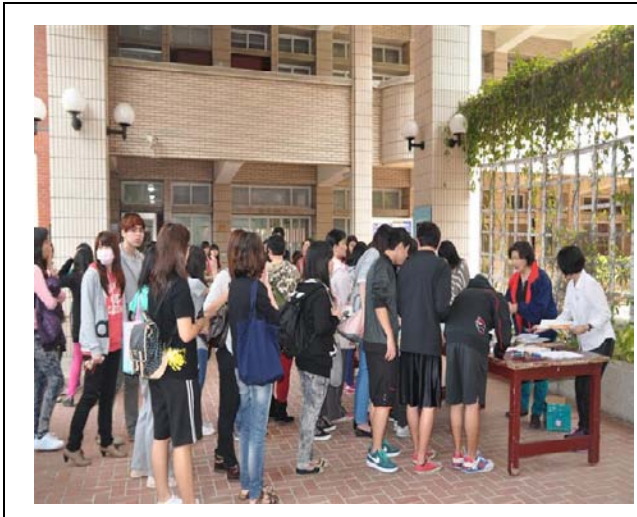
甄試說明會當天簽到盛況