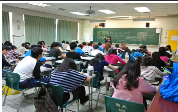
心理師為同學們解說