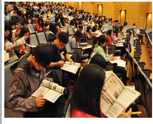
本校學生專心聽講