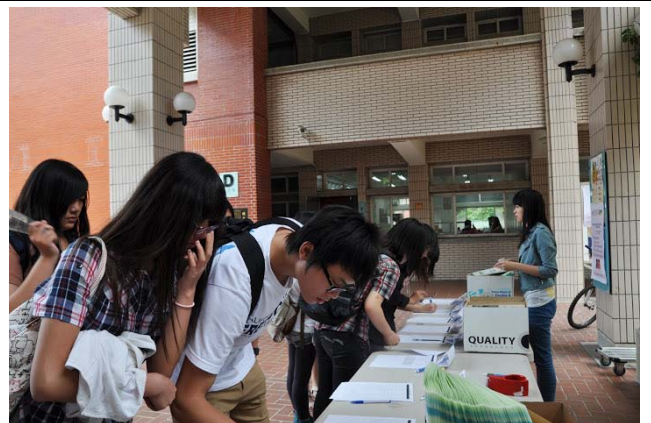
新生座談會當天，師資生簽到