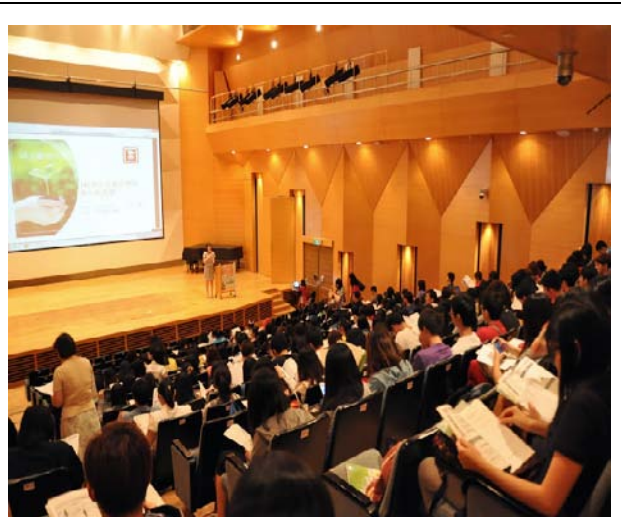
本校學生踴躍出席