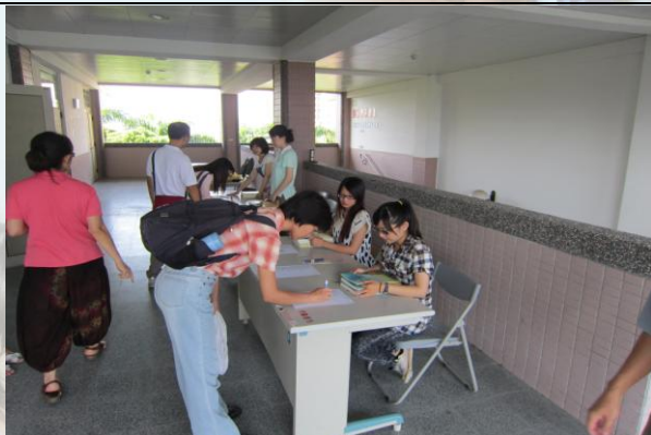
研習活動一堆，我當簽到處人員

也要與這些可愛的學生們、可敬的老師們道別。然而，現在我唯一能做的就是不斷地充實接下來的日子，讓自己能再更茁壯的成長，不辜負了師長們對我的指導。