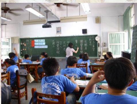
教導正確、有禮貌對於失明者、失聰者的稱呼