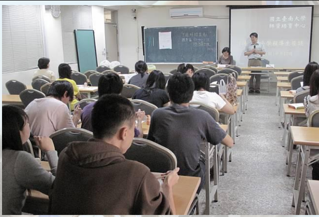
師培中心相關師長主持 100/10/06「教育學程導生座談」