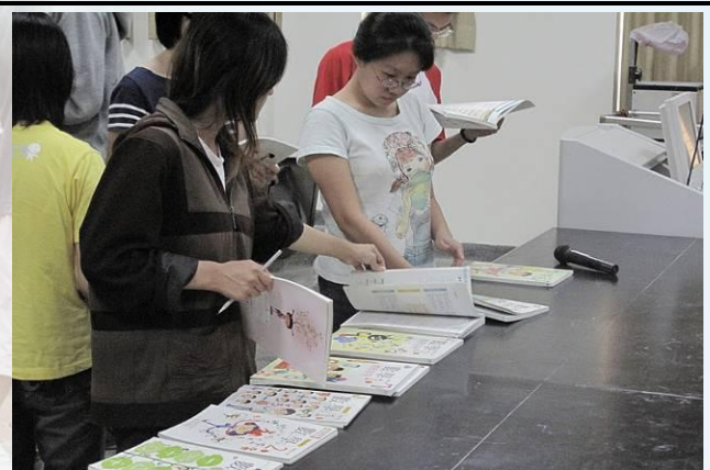
師資生教學專業能力訓練指導 (數學科創意教案工作坊)