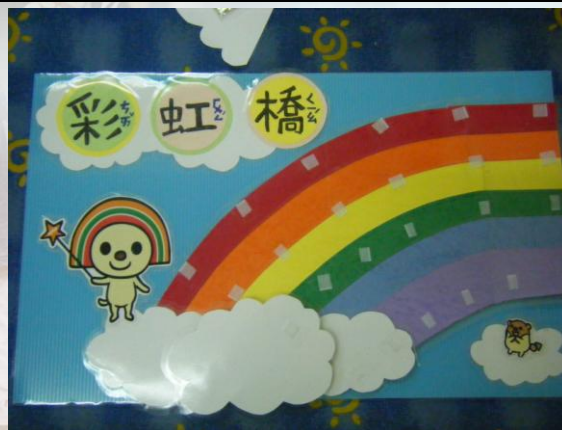
親手做的增強板，學生都非常喜歡