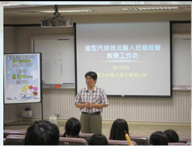
許誌庭老師為這次工作坊做開場解說