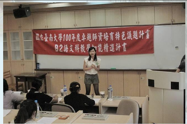
師資生教學專業能力檢定 (100/10/27 語文科說故事教學知能)