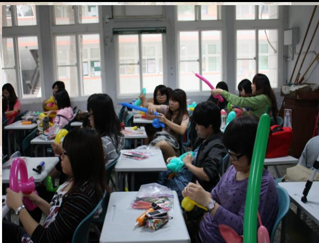
大家認真的學習，想必收穫一定很多