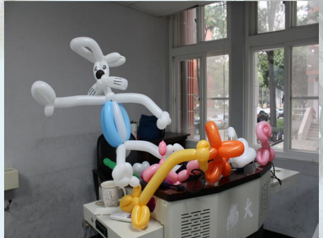
這是今天要上課的內容唷！