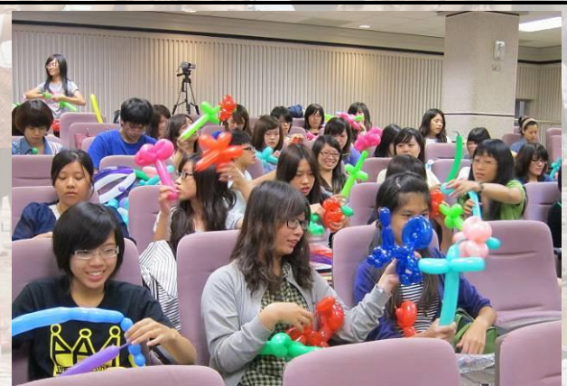
師資生教學專業能力訓練指導 (造型氣球教具融入班級經營能力)