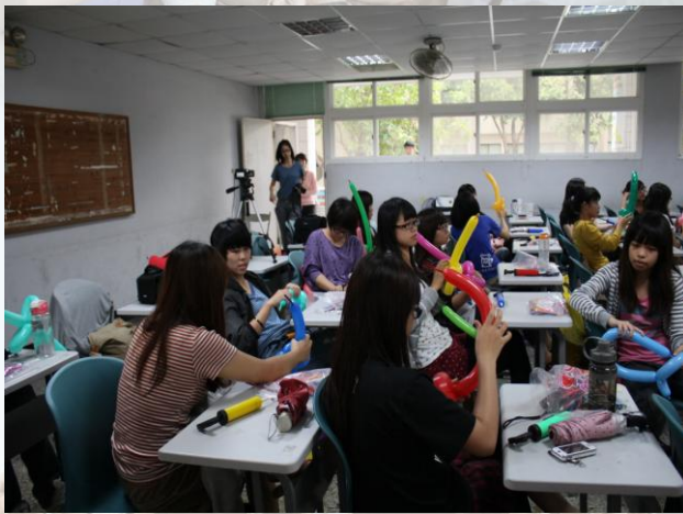
正在把帽子完成的階段