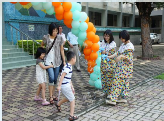
新生始業輔導，我是噴射泡泡的小丑