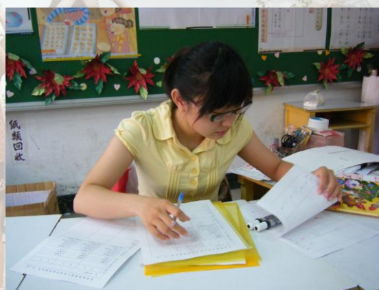
教學結束後，填寫聯絡單說明學生學習狀況