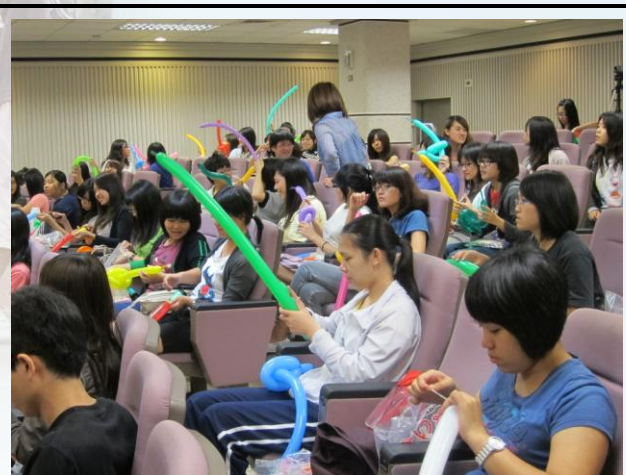
每位同學都很認真的學習如何折氣球