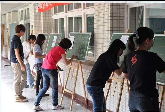
師資生教學專業能力訓練指導 (語文科板書教學知能)