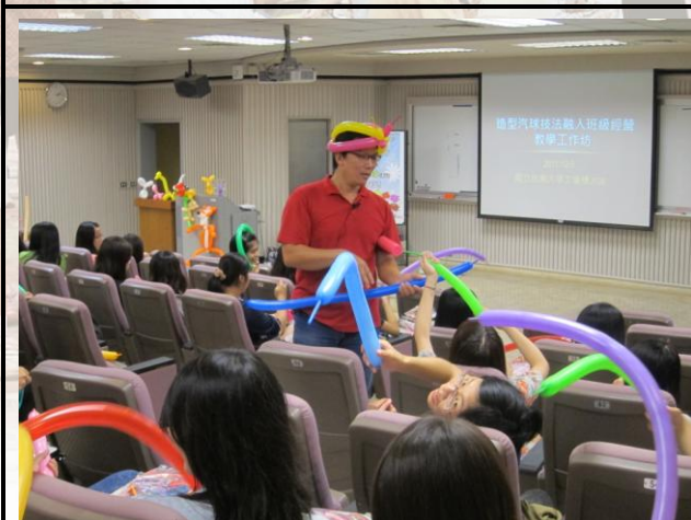
老師還會指導如何把氣球折得更美唷