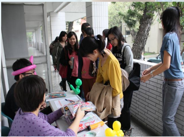
加開第二場還是很多人來參加！