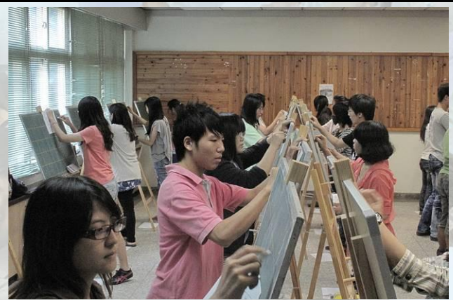
師資生教學專業能力檢定 (語文科板書教學知能)