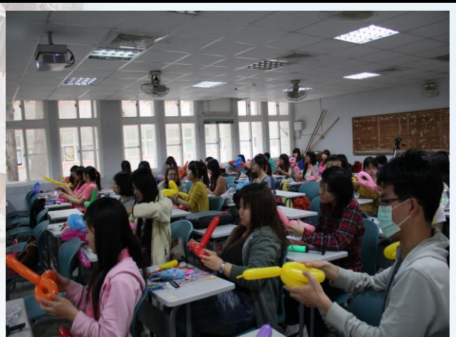
到底會做出什麼可愛的東西呢？