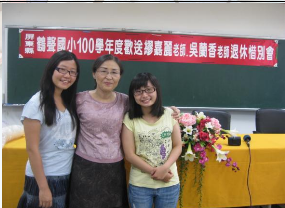
親自歡送導師退休