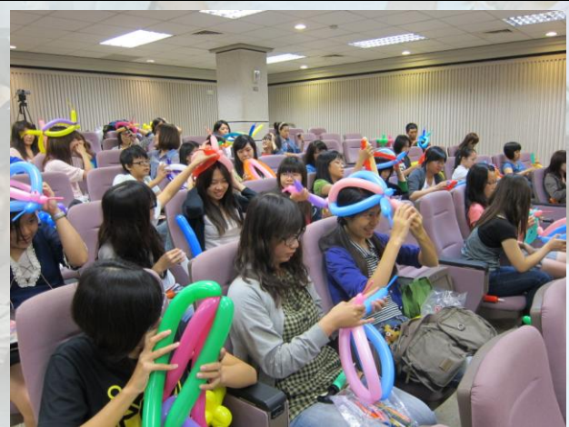
大家都有頂漂亮的帽子