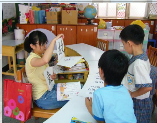
國語課，學生最愛找注音