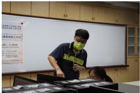
講師指導學生操作頁面