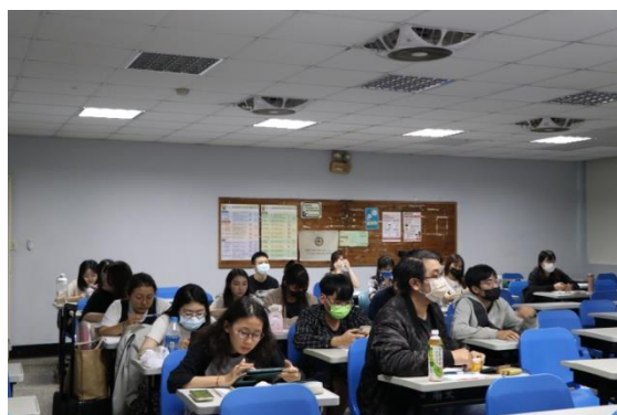
學生認真聽講學科知能內容