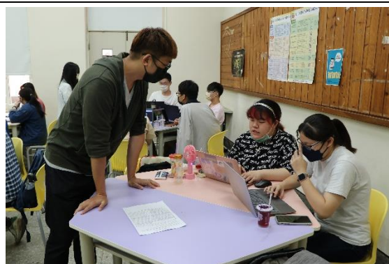
老師和學生討教案內容