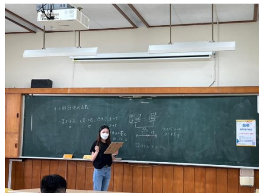
學生實體進行數學教學演示