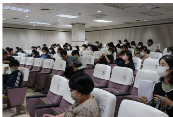
學生認真聽講的上課情形