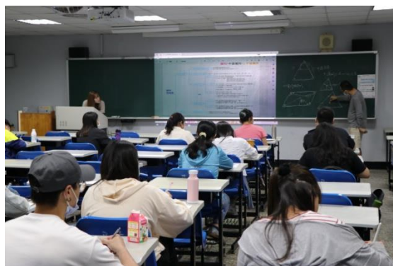
學生認真聽講學科知能內容