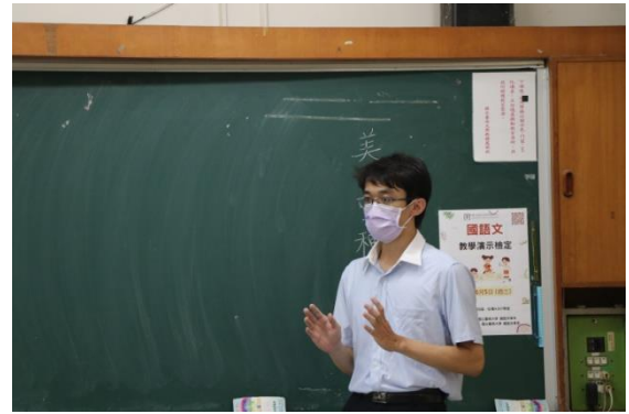
學生實體進行國語文教學演示