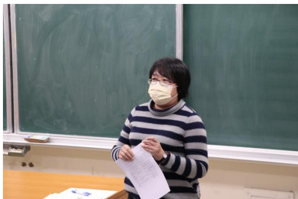
師培中心組長主持座談會