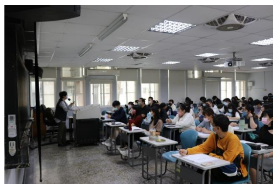
學生認真聽講板書技巧內容