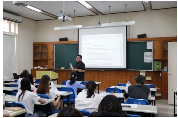
公民科的上課情形