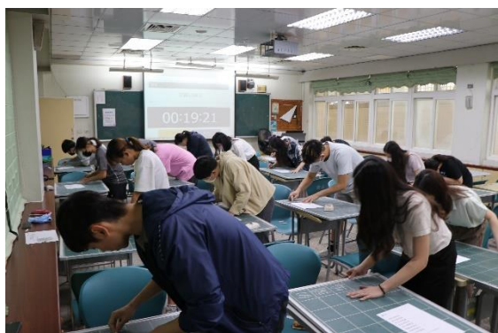
學生進行板書考試