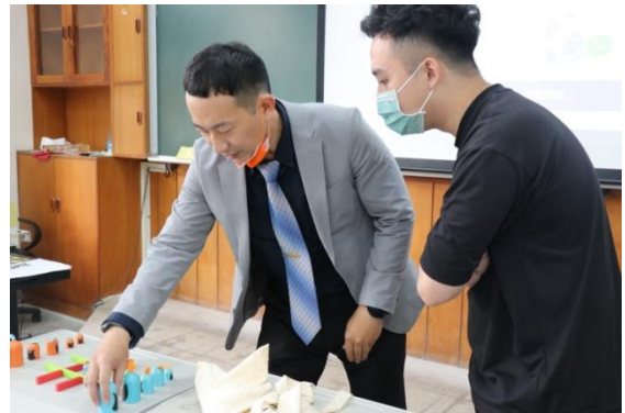
講師示範班級教學範例