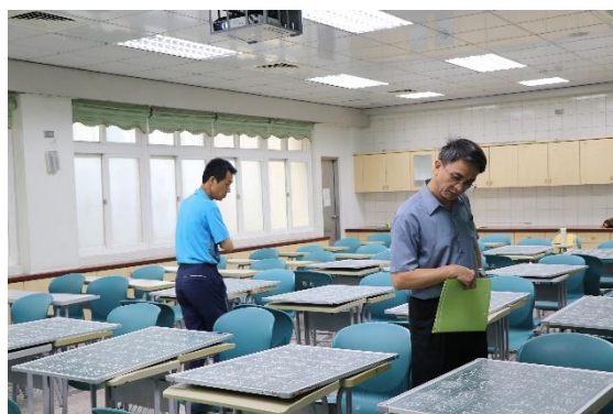
評審互相討論評分標準