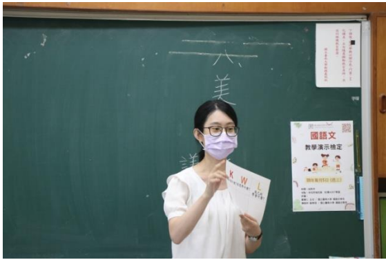
學生實體進行國語文教學演示