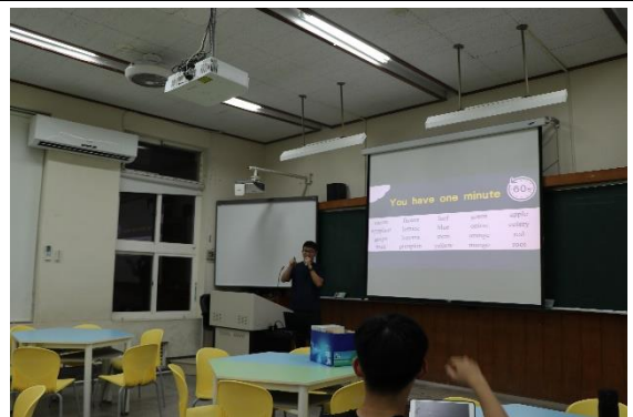
在課堂中老師隨時解答學生問題