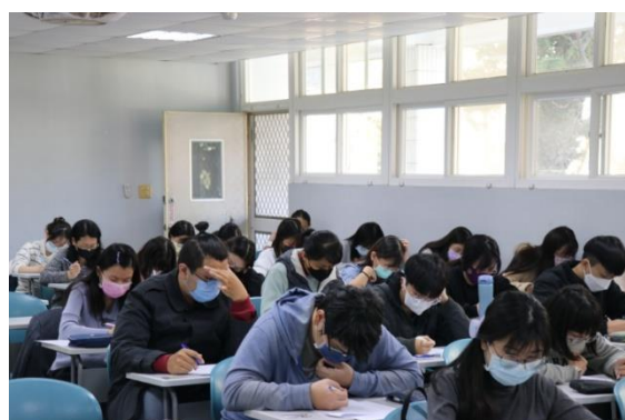
學生實體進行學科知能評量