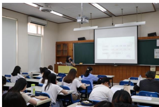
地理科的上課情形