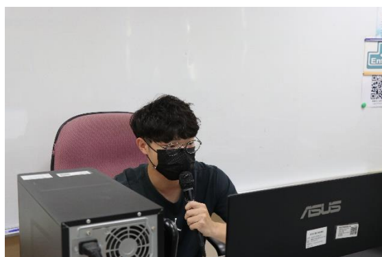
學生進行線上呈現成品