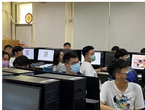
學生認真聽講的上課情形