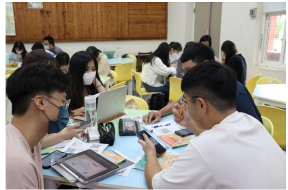
學生小組討論教案設計