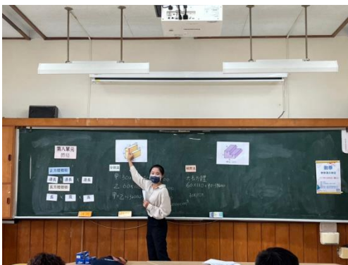
學生實體進行數學教學演示