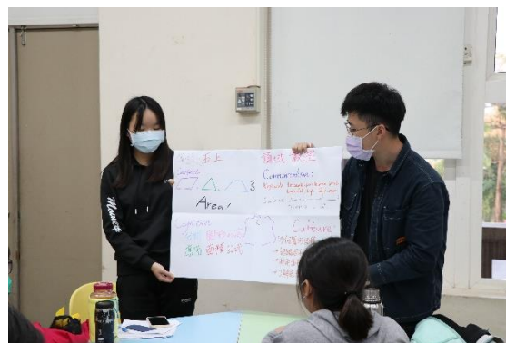
學生發表學習後的應用設計