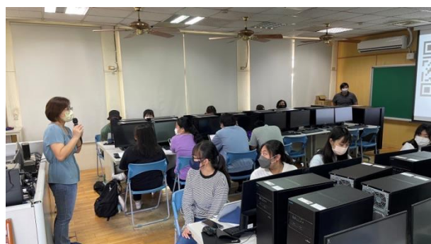
學生認真聽講的上課情形