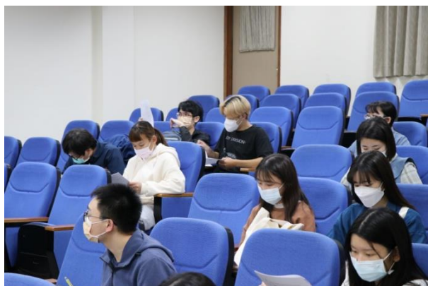
學生仔細聆聽宣導內容