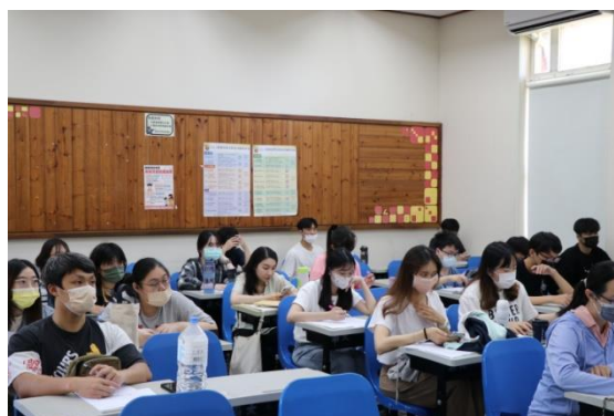
學生認真聽講學科知能內容