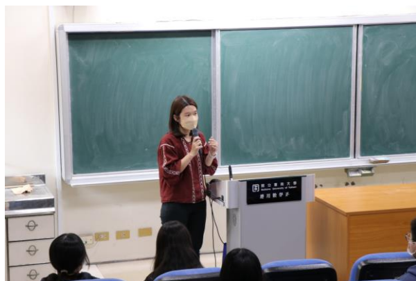
綜合業務組員為師獎生宣導注意事項