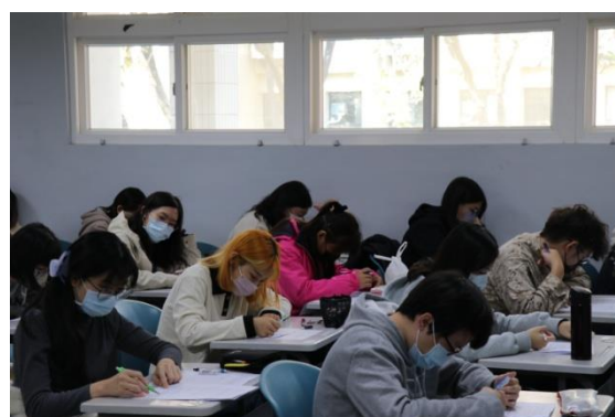
學生實體進行學科知能評量