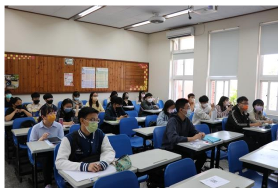
學生認真聽講重點的上課情形