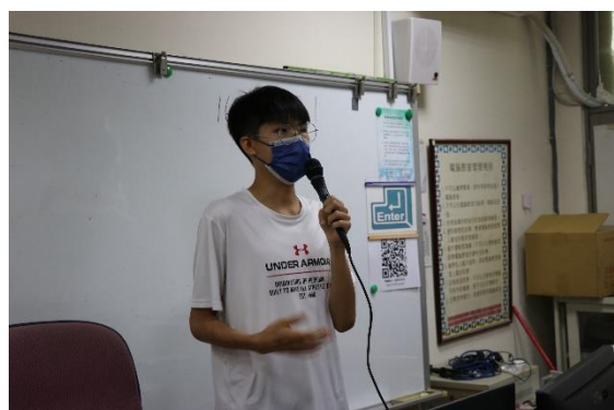
考前補充說明考試方式