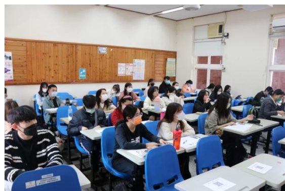
學生認真聽講重點的上課情形