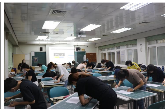
學生實際進行板書檢定的情況