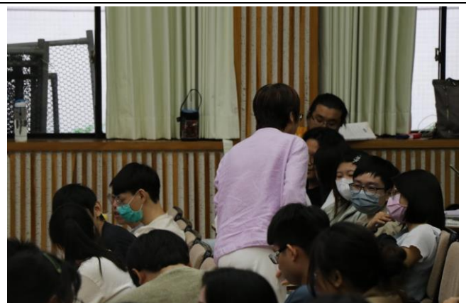
講師與學生共同討論