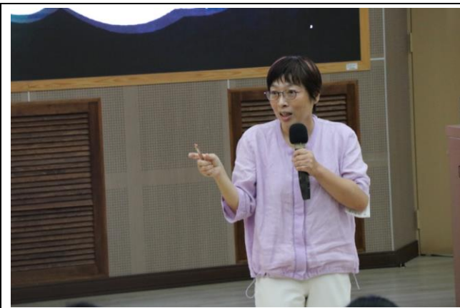
第一次全校性返校座談