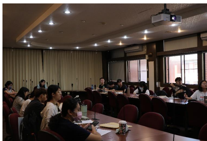
第二次集中實習會議情形