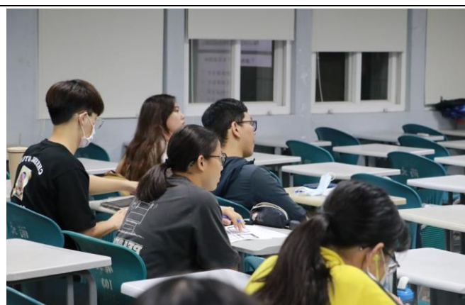
學生認真聽講講師講解內容