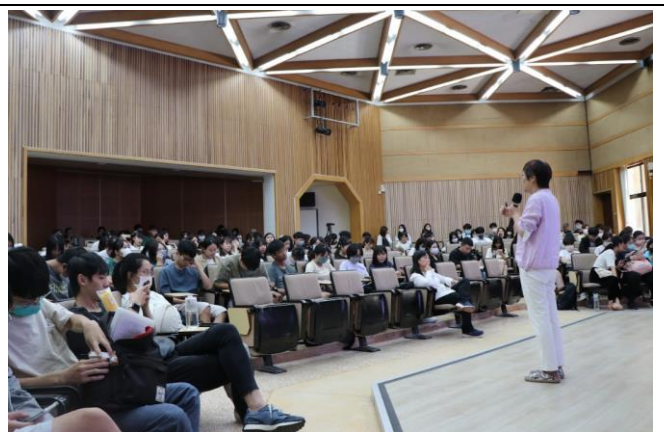
第一次全校性線上返校座談情況