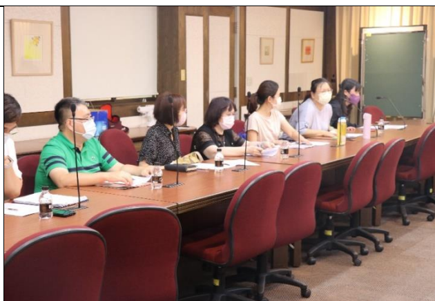
師資培育獎學金會議與會人員討論中