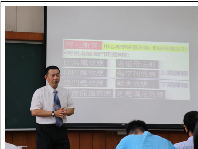
講師講解教育實務內容