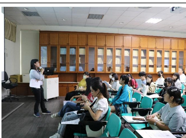
師資培育獎學金新生座談會