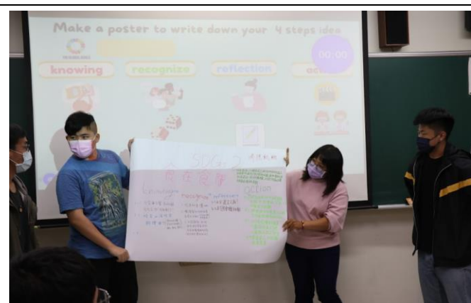
學生分享分組成果