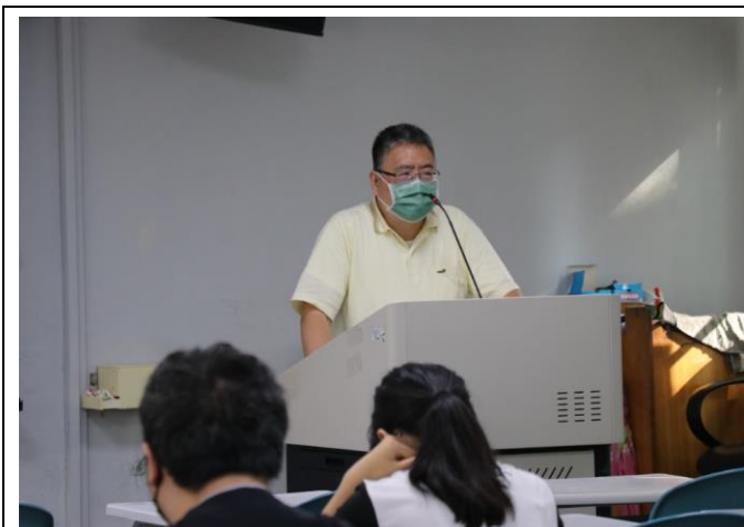
講師講解國語學科知能內容