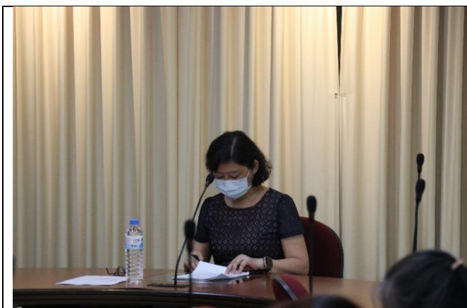
師資培育獎學金會議與會人員