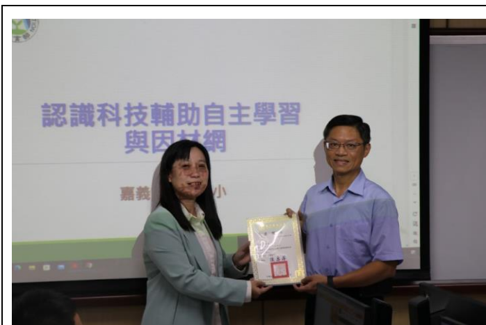
主任為講師頒發感謝狀