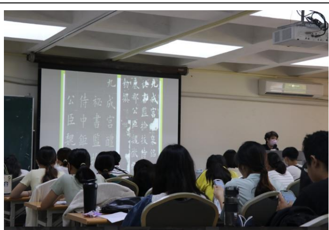
學生認真聽講板書研習