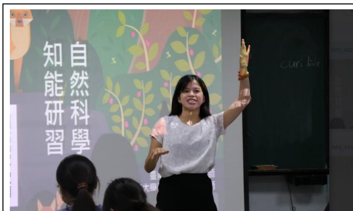
講師講解自然學科知能