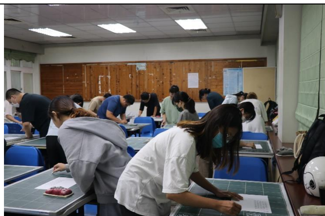
學生實際進行板書檢定的情況