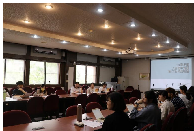
集中實習會議情形