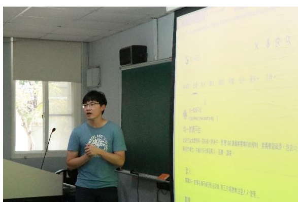
邀請台南女中自然科老師指導自然領域知能