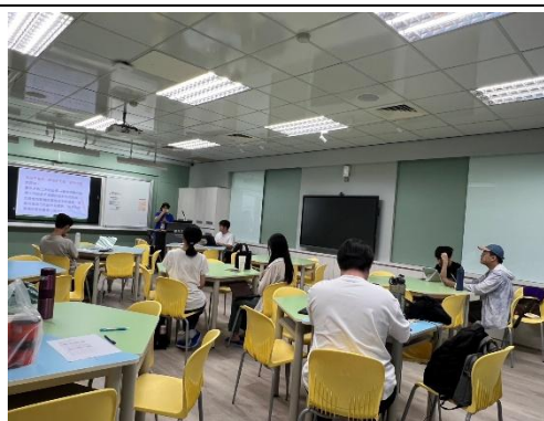
師資生討論簡報內容