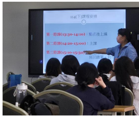
師資生認真聽講上課情形