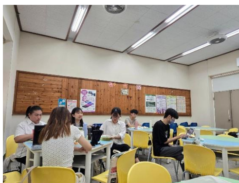
師資生交流雙語教學課輔經驗