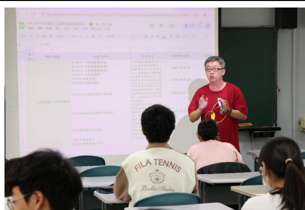
聯電課輔宣傳服務活動