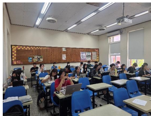
師資生專心聆聽研習內容