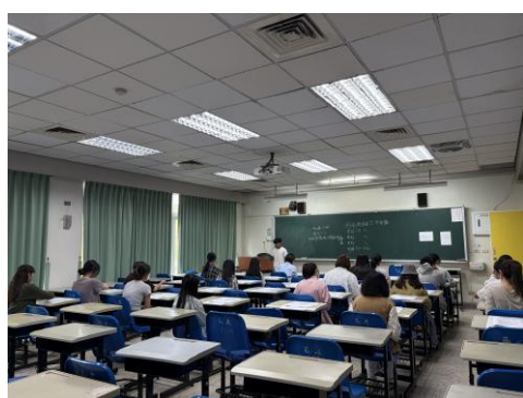
師資生實體進行教師資格考試模擬考