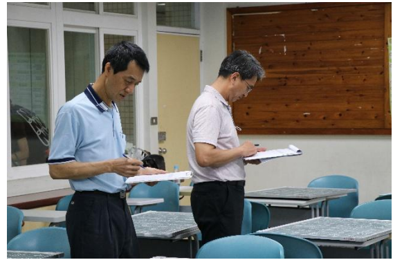
評審互相討論並進行評分