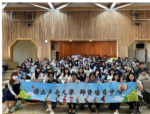
啟明苑開場活動校長蒞臨勉勵