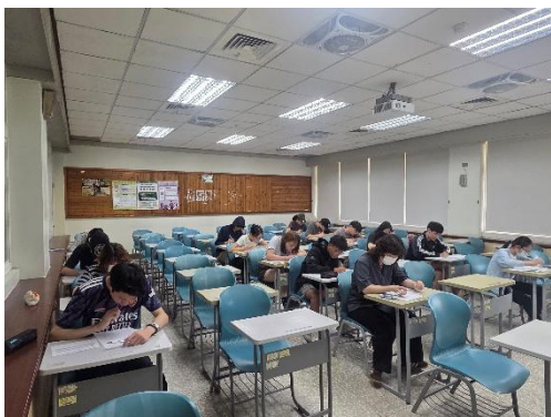
師資生實體進行學科知能評量