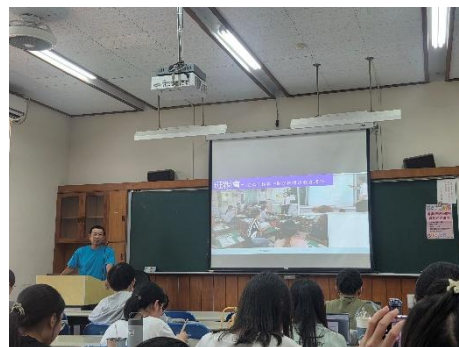
師資生學習班親會規畫