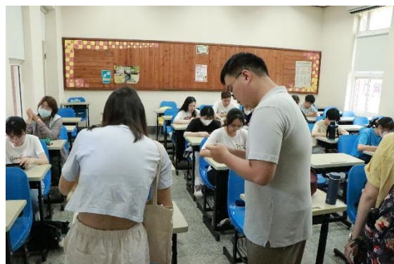
檢定前簽到並說明注意事項