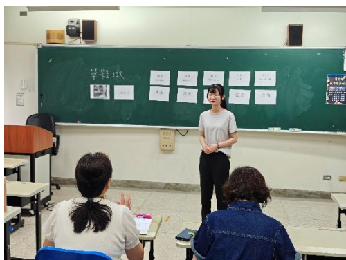
師資生實體進行閩南語教學演示