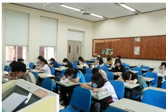
師資生進行班級教學實務能力檢定