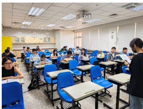
檢定前說明注意事項