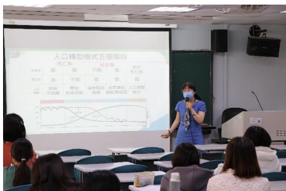
邀請南一中社會科老師指導社會領域知能