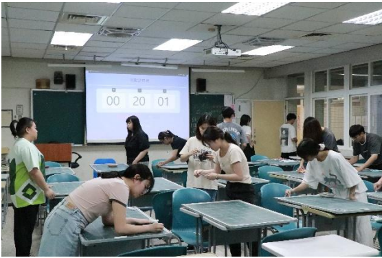
師資生進行板書檢定