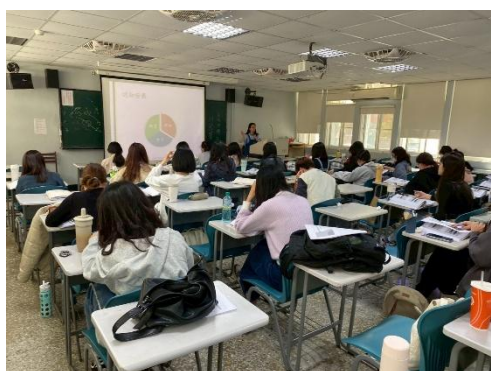
師資生認真聽講的上課情形