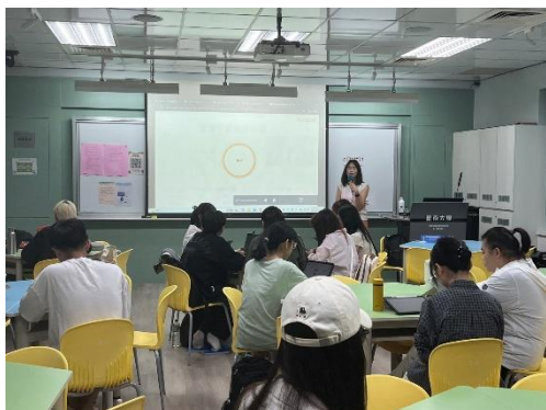
邀請文湘娥老師講授藝術領域雙語教學運用