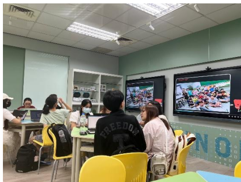
師資生進行實作小組討論