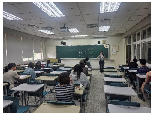
學生實體進行學科知能評量