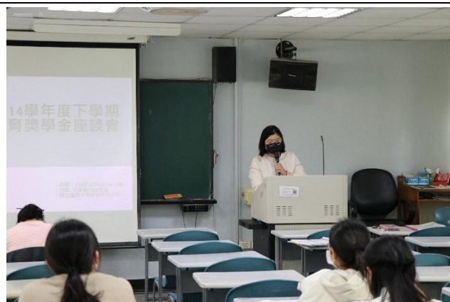
師獎生聆聽宣導注意事項