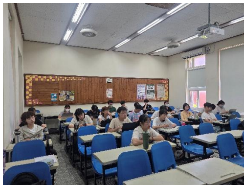
師資生專心聆聽研習內容