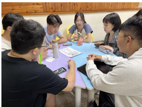
萬用教學桌遊設計