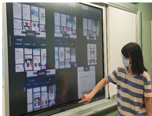
師資生上台實際操作