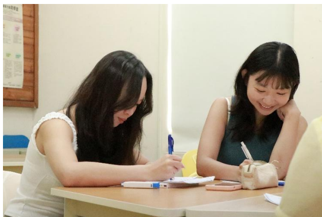
師資生用心筆記重點