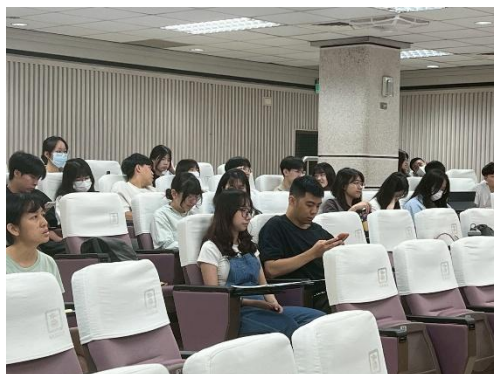
師資生認真上課的情形