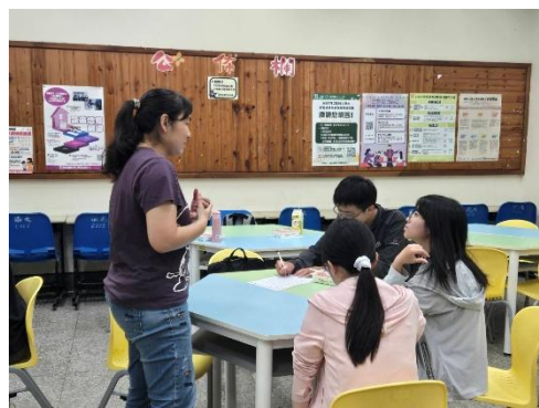
師資生認真聽講上課情形