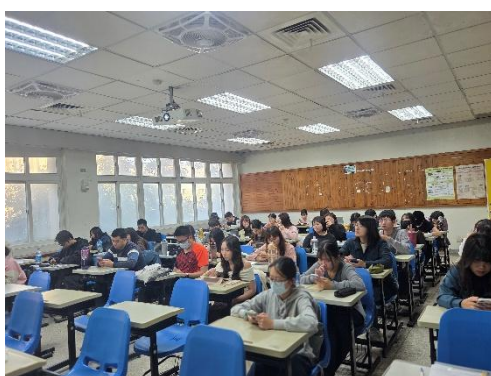
師資生專心聆聽研習內容