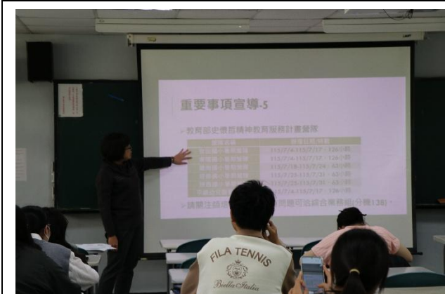
中心主任叮嚀重要事項