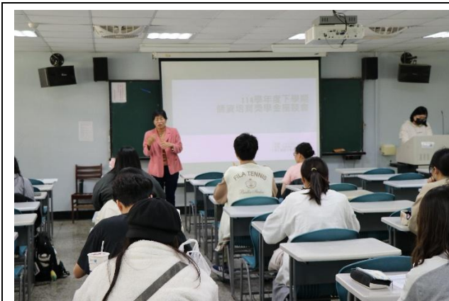
校長蒞臨座談會勉勵師獎生