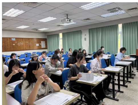
師資生實體進行教師資格考試模擬考