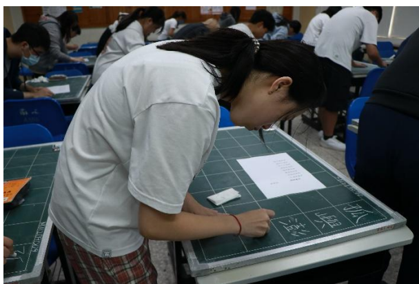
師資生專心進行檢定