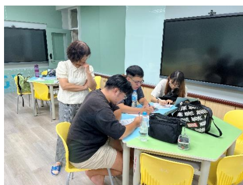
帶領師資生實際操作