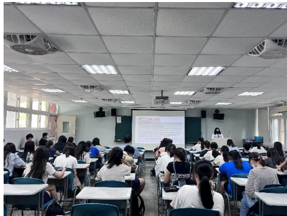
師獎生聆聽宣導注意事項