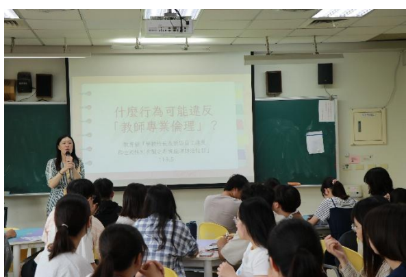
師資生踴躍參與研習活動