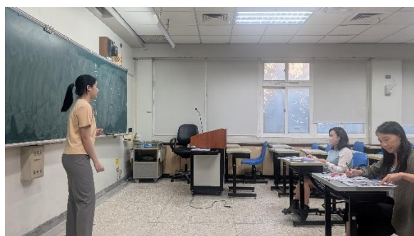
師資生實體進行國文教學實務檢定