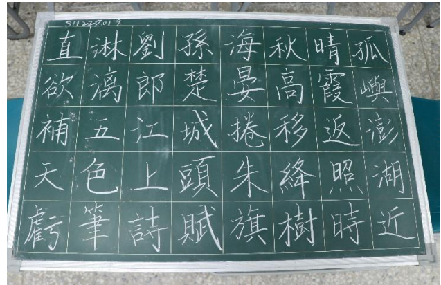
師資生板書檢定作品