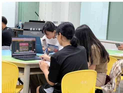
師資生實際操作體驗與交流