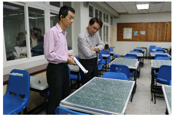
評審互相討論並進行評分