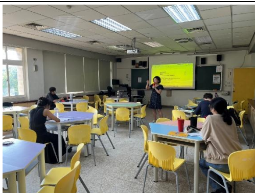
師資生參與雙語教學實務討論