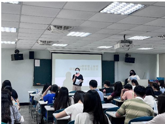
教輔組組長叮嚀重要事項