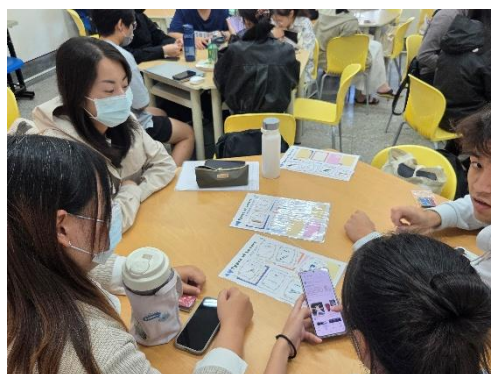
師資生針對研習內容進行討論