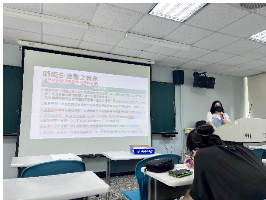
中心組員傳達重要資訊