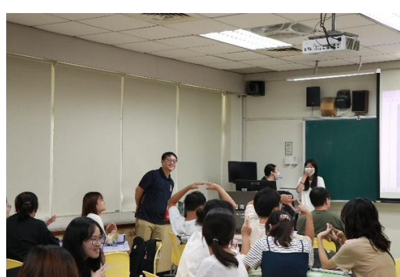
講師與師資生交流互動