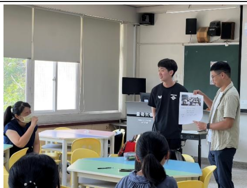
師資生上台分享課室英語