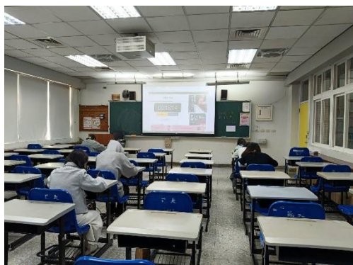
師資生實體進行學科知能評量