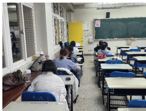
檢定前師資生聆聽注意事項