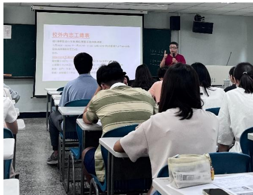
聯電課輔宣傳服務活動