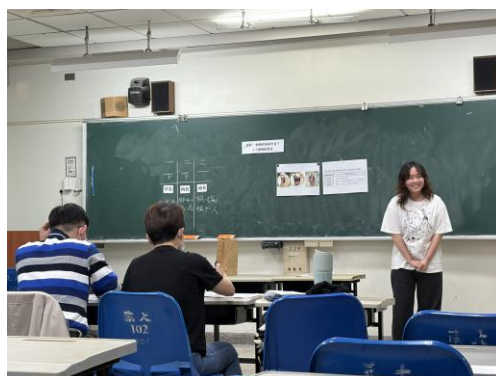
師資生進行自然教學實務檢定