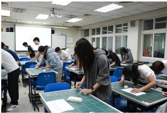
師資生進行板書檢定