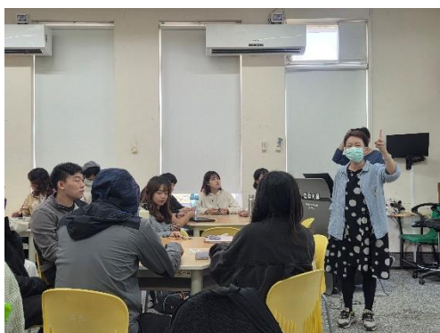
講師分享自然教學實務