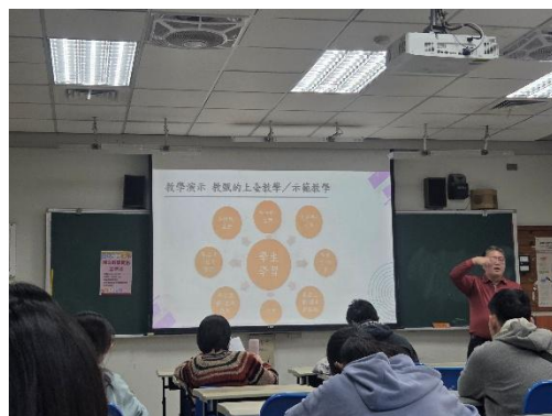
師資生專心聆聽研習內容