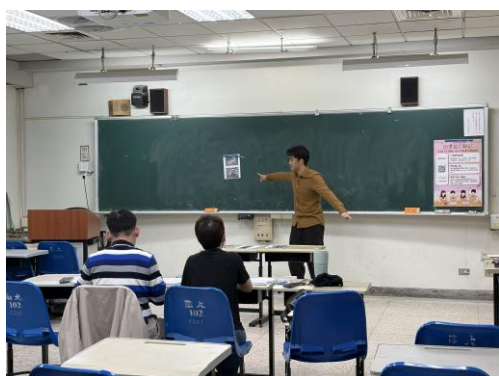
師資生進行自然教學實務檢定