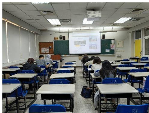
學生實體進行學科知能評量