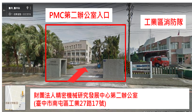
圖 2 第二辦公室工廠一樓教室路線