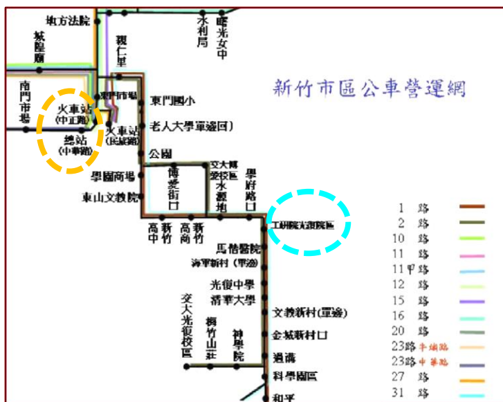
圖四、光復院區 周邊公車營運網 ( https://reurl.cc/D9xLgE )

台鐵：搭乘台鐵抵達新竹站→轉搭 世博5號 ，於「工研院光復院區」站下車即可抵達。 路線： 火車站 →(東區區公所)→...→(老人大學)→ 工研院光復院區 ，下車即達。