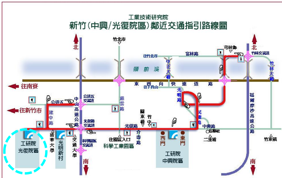
圖一、工研院 光復院區 鄰近交通指引圖

中興院區：新竹縣竹東鎮中興路4段195號 電話：03-5820100 光復院區：新竹市光復路2段321號 電話：03-5721321