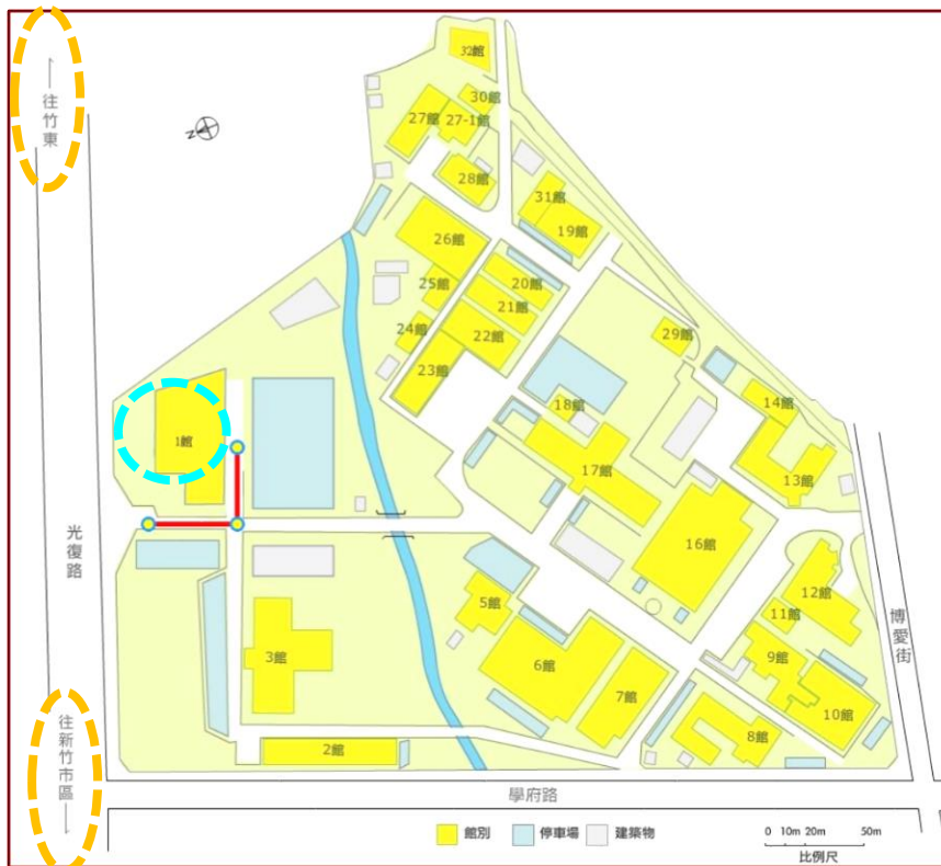
圖二、光復院區內指引圖