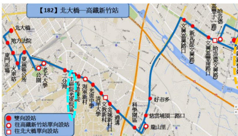
圖六、182 市區公車路線圖與時刻表 ( https://reurl.cc/E7mLG1 )

台鐵：搭乘台鐵抵達新竹站→轉搭 計程車 ，於「工研院光復院區」下車。 高鐵：搭乘高鐵抵達新竹站→轉乘 182 市區公車於「工研院光復院區」站下車即可達。 路線： 高鐵新竹站 →...→(清華大學)→...→(馬偕醫院)→ 工研院光復院區 ，下車即達。